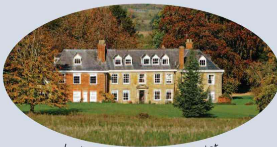
Ladbroke Hall from viewpoint