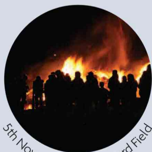
5th November on Farmyard Field